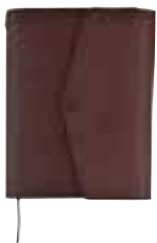
ダークブラウン WEB SHOP限定