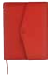
レッド WEB SHOP限定