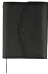
ブラック WEB SHOP限定