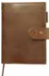
A&S Brown ARTS&SCIENCE店舗限定