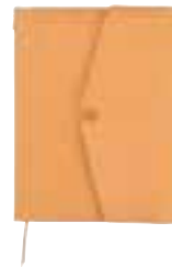
ナチュラル WEB SHOP限定