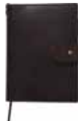
A&S Dark brown ARTS&SCIENCE店舗限定