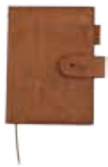
ブラウン WEB SHOP限定