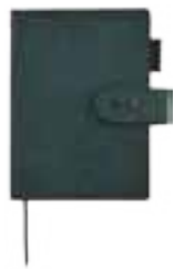
ブルー WEB SHOP限定