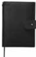
A&S Black ARTS&SCIENCE店舗限定